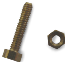
Standardschraube D=1,2mm (Aufbauanleitung Punkt 14) Standard screw D=1.2mm (Assembly Instruction Point 14)