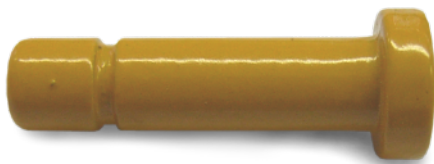
Bolzen 3,9 x 17mm (Aufbauanleitung Punkt 6) Pin 3.9 x 17mm (Assembly Instruction Point 6)